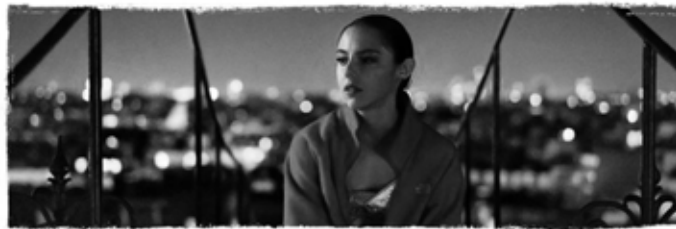
EIN FILM VON CÉDRIC KLAPISCH

Montag : Kinotag 7 € (außer an Feiertagen)